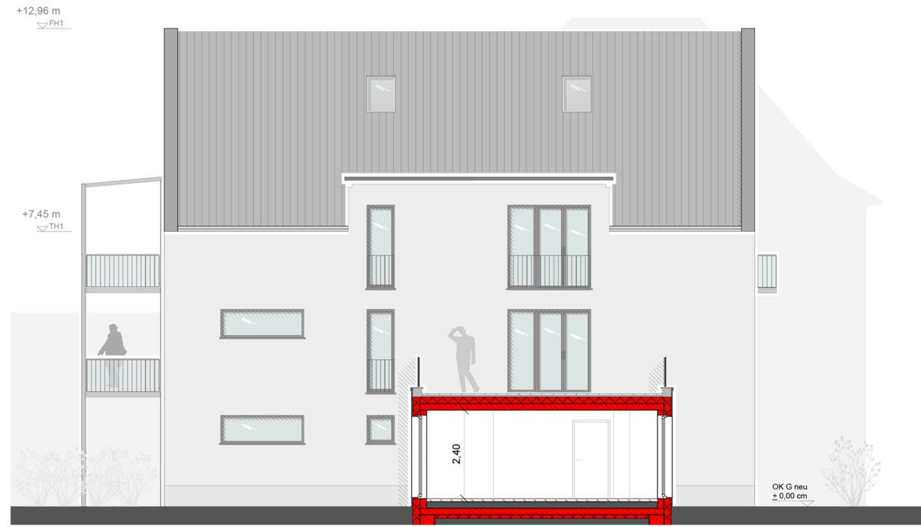
Ansicht Hohenzollernstr. 32 | Ost