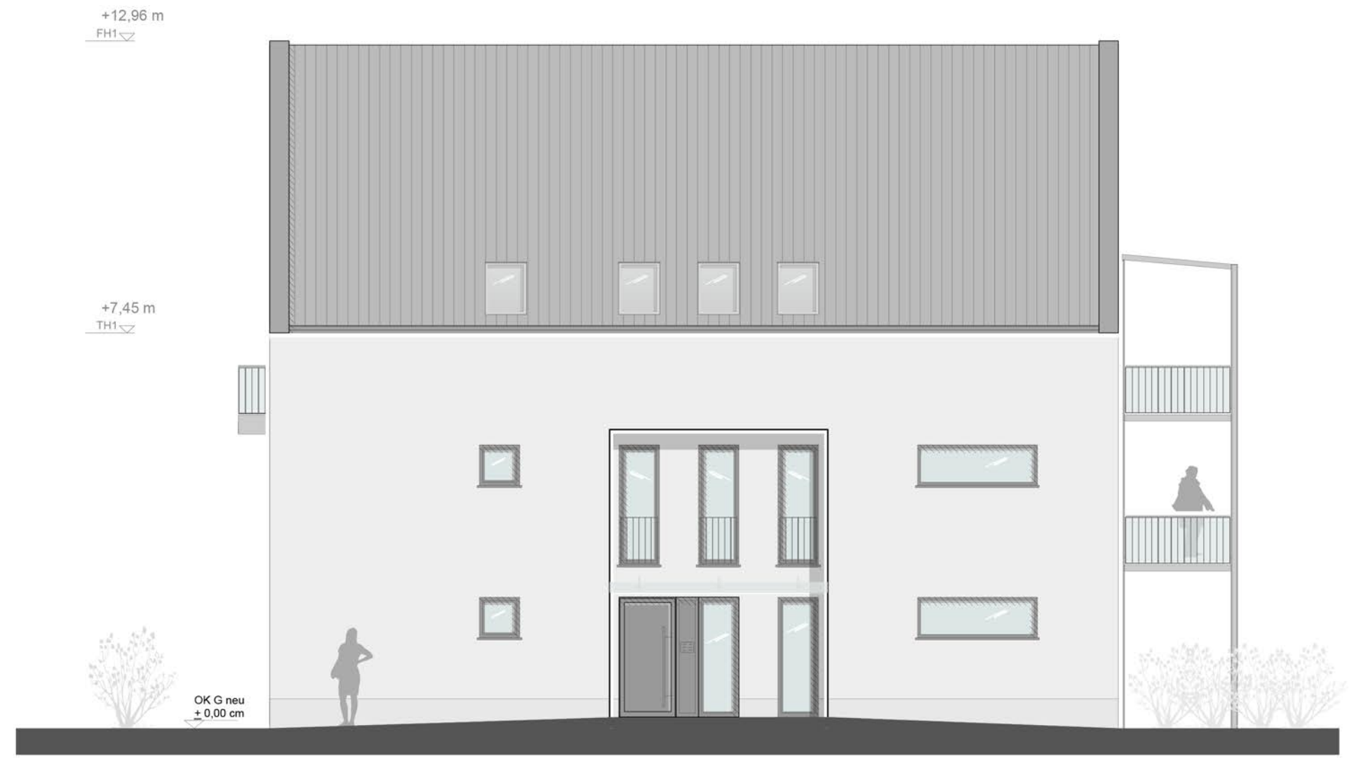
Straßenansicht Hohenzollernstr. 32 | West