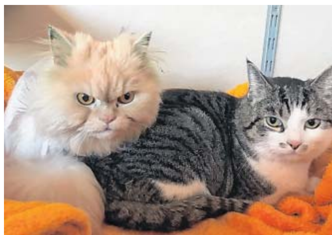
Unzertrennlich: Der Perser-Kater Aragorn und sein Kumpel Aladin wurden bislang in einer Wohnung gehalten.

Leider wurde dadurch auch die Fellpflege so stark vernachlässigt, dass Aragorn zuerst von dicken Fellplatten befreit werden musste. Anfangs verhielten sich die zwei lieben Kater noch etwas schüchtern, doch nun ist die Zeit des ersten Abtastens vorbei und es wird mit den Pflegern gern und ausgiebig gekuschelt. Bisher lebten Aragorn und Aladin in rei-